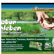
VEREIN ÖKONETZ STEIERMARK-SÜD (Ökonetz Steiermark Süd)

Kronnersdorf 72 8345 Straden M. +43 (0)664 / 84 18 338 http://www.oekonetz.com