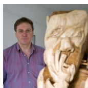
GALERIE LEBENSWELTEN (Johnny Fortmüller)

Radochen 11 8484 Straden M. +43 (0)664 / 27 44 071 http://www.johnny-fortmueller.at