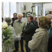
HEILWASSER-MUSEUM JOHANNISBRUNNEN UND HOCHZEITSMUSEUM (Johann Müller)

Radochen 11 8484 Straden M. +43 (0)664 / 27 44 071 http://www.johnny-fortmueller.at