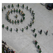
MARKTMUSIKKAPELLE STRADEN (Marktmusikkapelle Straden)

Straden 98 8345 Straden T. +43 (0)664 / 82 52 521 http://www.marktmusik-straden.at