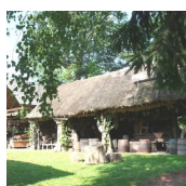
NOSTALGISCHES LANDLEBEN (Familie Wiedner)

Straden 98 8345 Straden T. +43 (0)664 / 82 52 521 http://www.marktmusik-straden.at