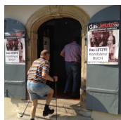
STRADEN AKTIV (Wolfgang Seidl)

Straden 25/9 8345 Straden T. +43 (0)3473 / 8207 M. +43 (0)676 / 62 53 606 http://www.straden-aktiv.com