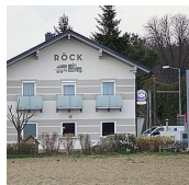
TANKSTELLE GASTHAUS RÖCK (Gert Röck)

Radochen 61 8484 Straden T. +43 (0)3475 / 2333 M. +43 (0)664 160 36 87 http://www.roeck.biz