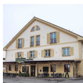
GASTHOF STRADNERHOF (Jeka Benkic)

Straden 23 8345 Straden T. +43 (0)3473 / 8202 http://www.stradnerhof.com