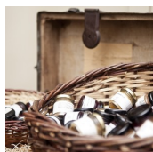
GREIßLEREI DE MERIN (Greißlerei De Merin)

Straden 5 8345 Straden T. +43 (0)3473 / 75 9 57 http://www.demerin.at